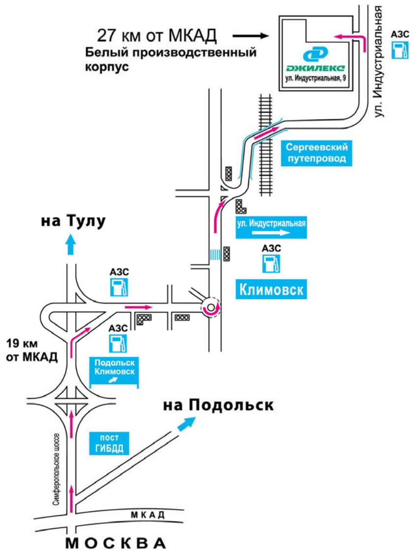
СХЕМА ПРОЕЗДА ОТ МОСКВЫ

Завод изготовитель. Сервисный центр Зал оптово-розничной торговли